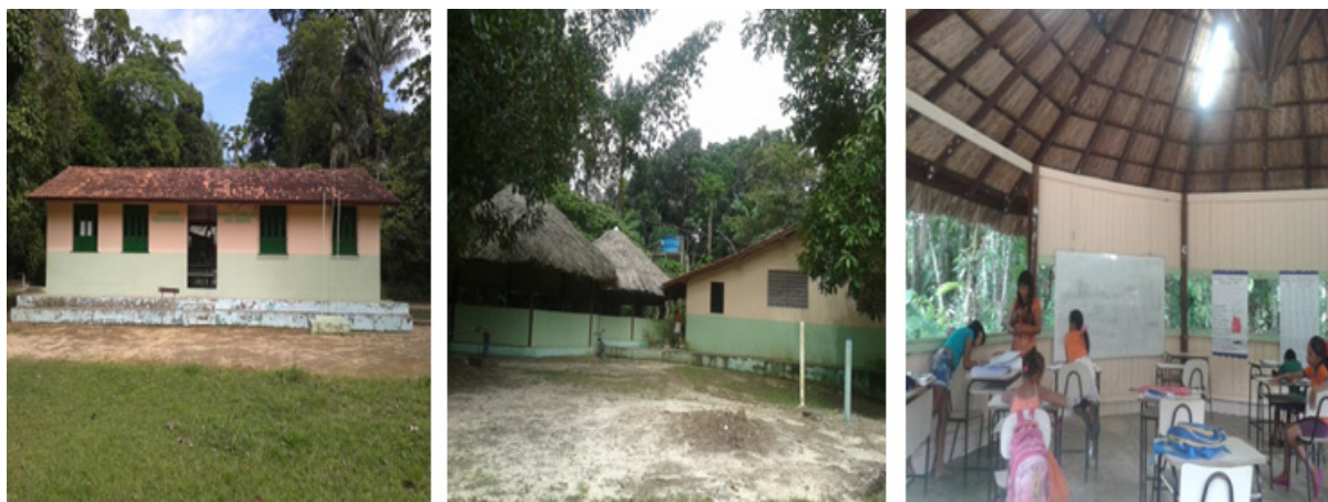
Figuras 1, 2 e 3: Unidade Pedagógica Maria Clemildes dos Santos, comunidade Castanhal do Mari-Mari, ligada à Escola Remígio Fernandez, bairro do Maracajá, Distrito Administrativo de Mosqueiro.

pedagógicos na Unidade (SILVA; SANTOS, 2010). Elas substituíram os antigos anexos que eram, por assim dizer, apenas um prolongamento de uma “escola mãe”.